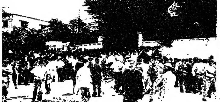
تقدم حوالي 600 متطوع لدورة اغراق في الجيش في نكته محمد زغب في صيدا

هذا المثل الذي يفتخر به الشعب اللبناني، واهتم بالوضع التربوي في المدارس الجعفرية، واهتم بالوضع التربوي في المدارس الجعفرية، واهتم بالوضع التربوي في المدارس الجعفرية.